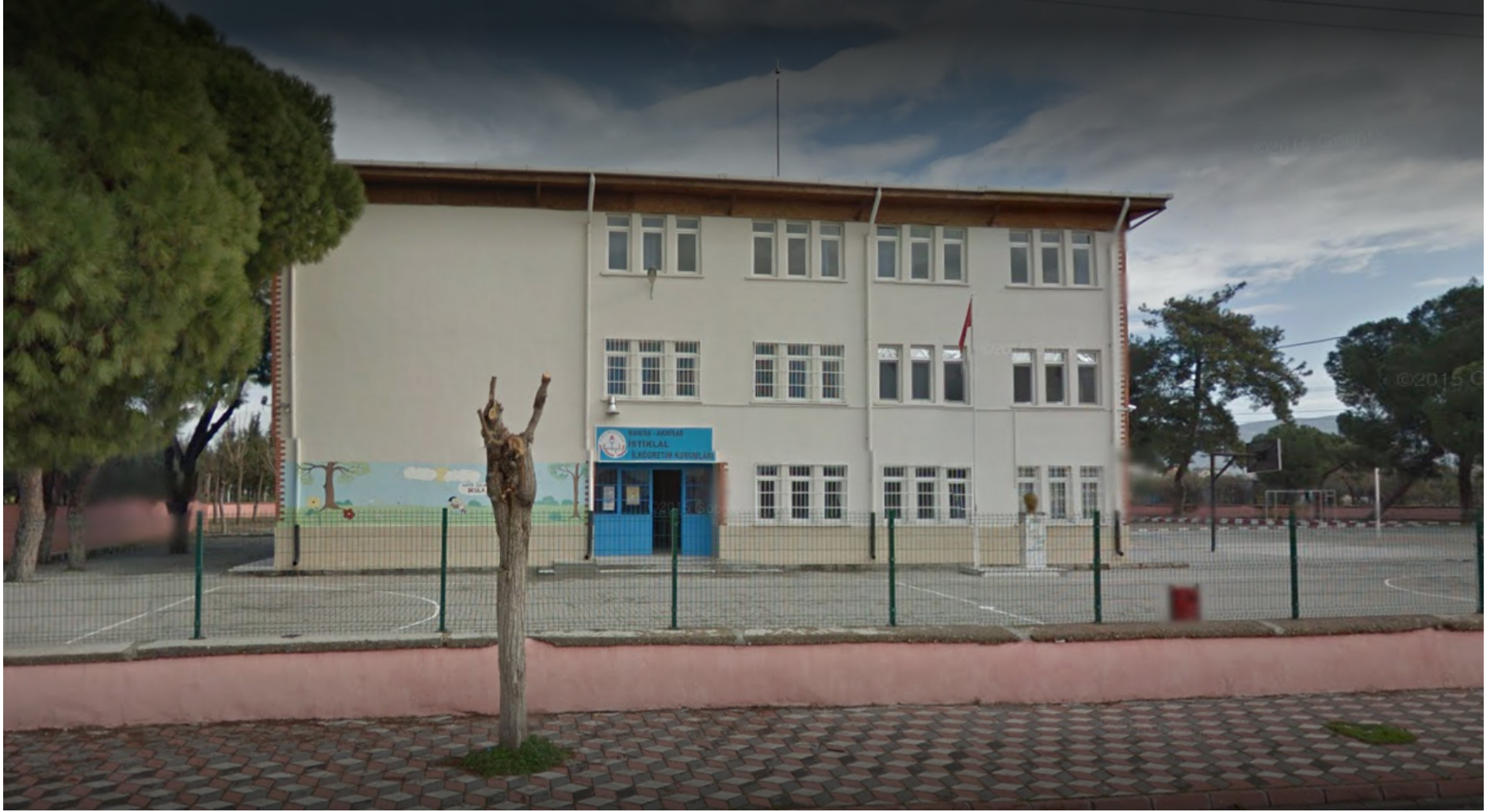
AKHISAR İSTİKLAL ŞEHİT MUSTAFA ÇÜRÜK İLKOKULU